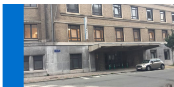
Centre Médical Edith Cavell rue Général Lotz, 37 1180 Bruxelles