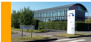
Centre Médical Jean Monnet Avenue Jean Monnet, 12 1400 Nivelles