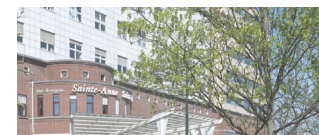
Chirec - Site Ste Anne St Remi Boulevard Jules Graindor, 66 - 1070 Bruxelles