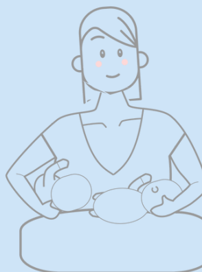
1 bébé en madone 1 bébé en rugby