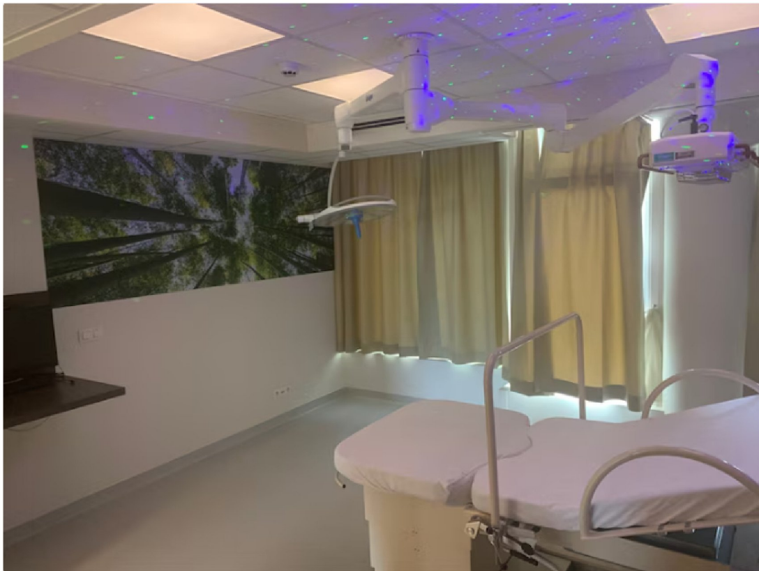
Inauguration de la nouvelle maternité brainoise.