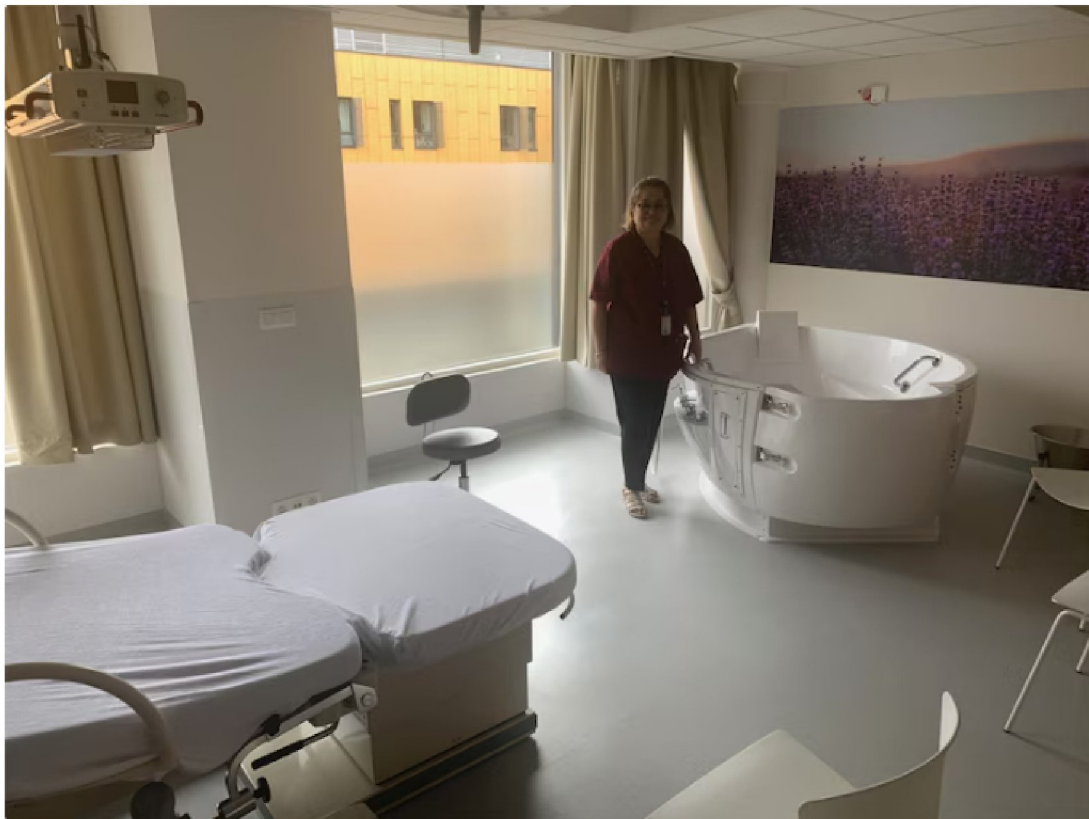
Inauguration de la nouvelle maternité brainoise.

Les parents pourront ainsi vivre cette expérience unique de la naissance d'un enfant dans le cocon douillet de la salle Coton, les tons violets et apaisant de la salle Lavande, les couleurs chaudes de la salle Dune, le vert doux de la salle Bambou, ou en bénéficiant de la large vue sur la campagne qu'offre la salle Horizon.