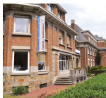
Centre Médical EUROPE - LAMBERMONT Rue des Pensées, 1-5 1030 Bruxelles