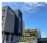
Site BRAINE-L'ALLEUD - WATERLOO Rue Wayez, 35 1420 Braine-l'Alleud