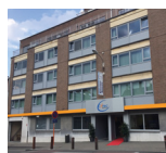
Clinique de la BASILIQUE Rue Pangaert, 37 - 47 1083 Bruxelles