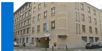
Medisch Centrum Edith Cavell Generaal Lotzstraat, 37 1180 Brussel